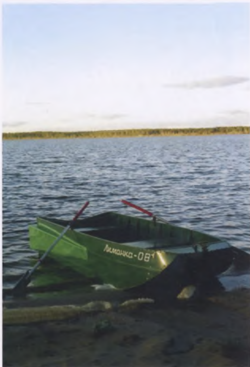
Импровизированное ожидание каторжанина (Лимонова Э.В.)