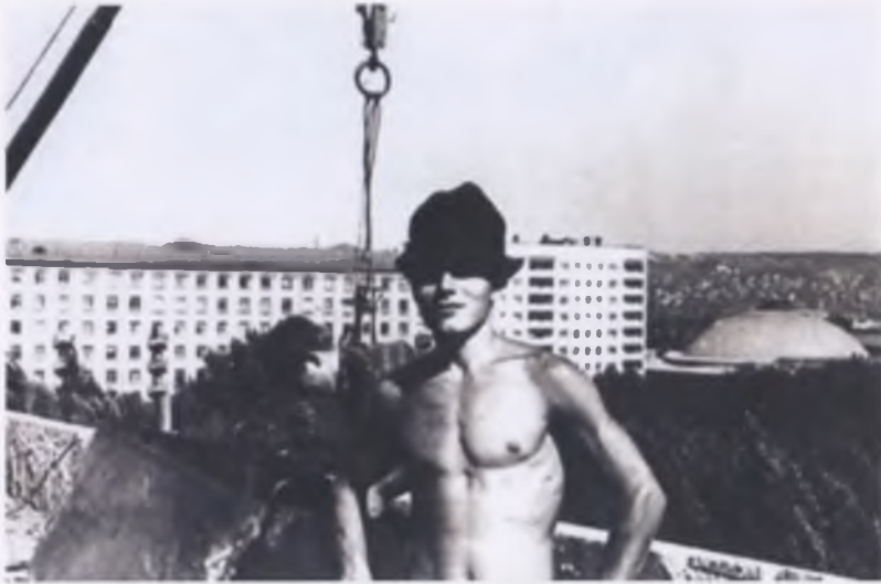
Саратов, работа на стройке