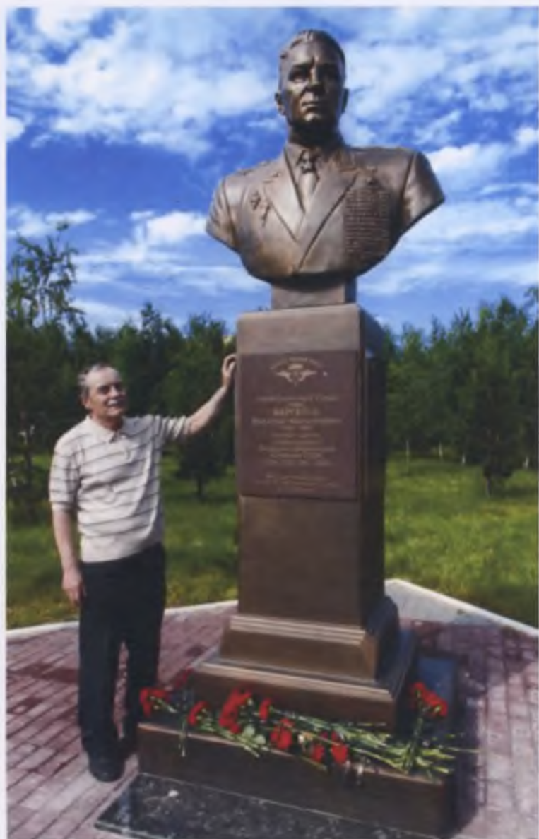
Памятник герою земли и неба Маргелову Василию Филипповичу, г. Ноябрьск