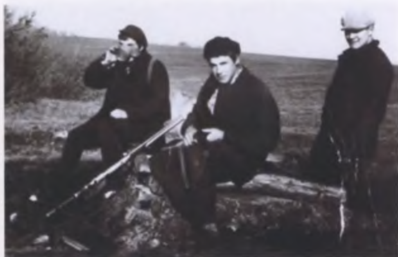
Гудяев родник. Сельские охотники на привале. Автор – слева