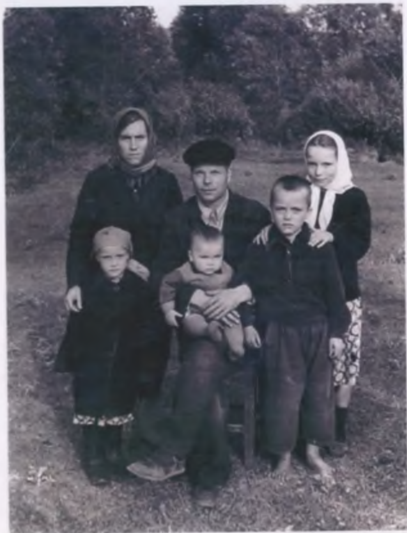
Наша семья, 1957 год