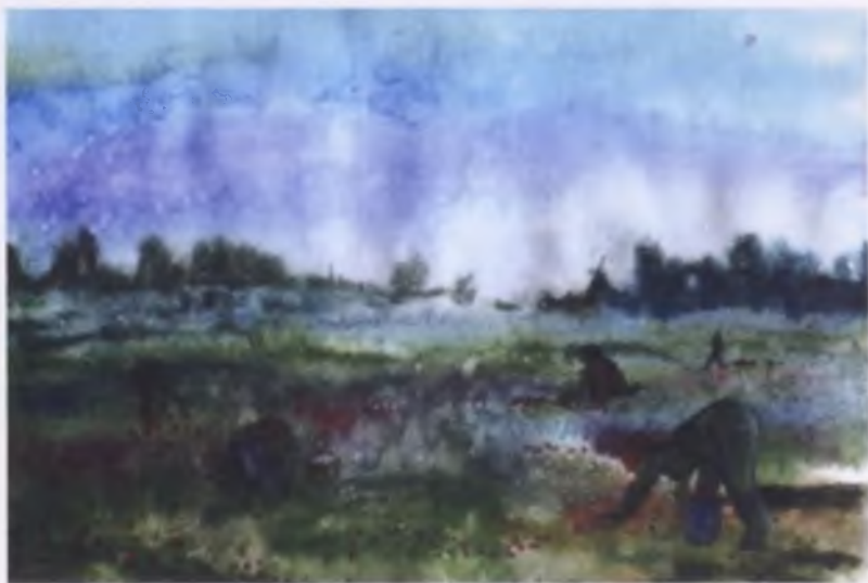
«Напали на клюкву», иллюстрация художника Т. Мушкиной