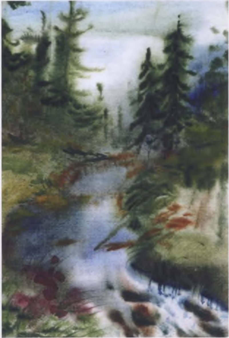
«Из северных снов», иллюстрация художника Т. Мушкиной