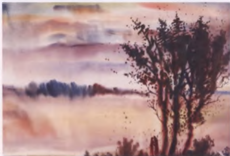
«Русская осень», иллюстрация художника А.А. Пашина