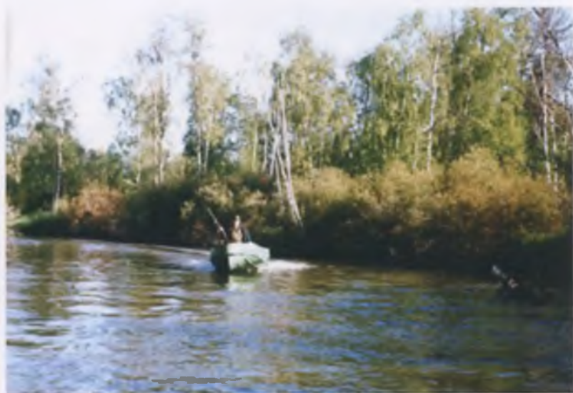
Река Ханаяха, г. Ноябрьск