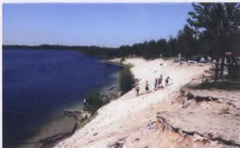
«Ноябрьск как остров». Озеро Светлое.