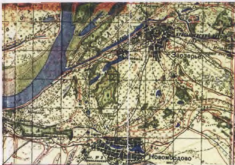
Куйбышевский (Спасский) затон до затопления водохранилищем, родина предков моего сына, 1957 год