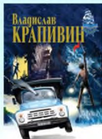
Журавленок и молнии

10. Крапивин В.П. Журавленок и молния; Валькины друзья и паруса [Текст] / В.П. Крапивин. - Москва: ЭКСМО, 2008. - 480 с.: ил. - (Библиотека Командора).