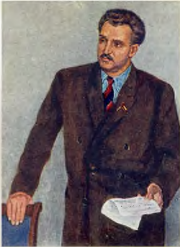
П. КОНЧАЛОВСКИЙ ПОРТРЕТ К. М. СИМОНОВА