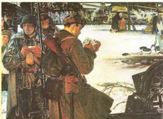
Х. ЯКУПОВ ФРОНТОВЫЕ ЗАРИСОВКИ

Симонов, К. Ты помнишь, Алеша, дороги Смоленщины [Текст] // Час мужества: стихи о войне / сост. В.А. Костров, Г.Н. Красников. – Москва, 2005. – С. 112–114.